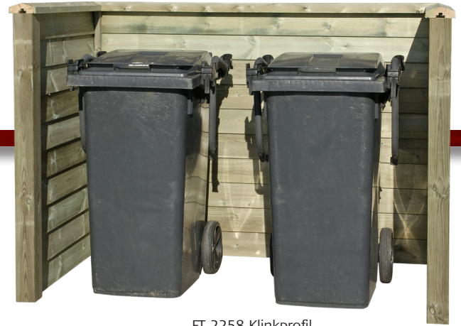
FT 2258 Klinskprofil