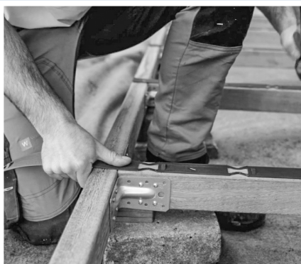
2. Stræk og tilpas Flexspacer til længden af strøerne.