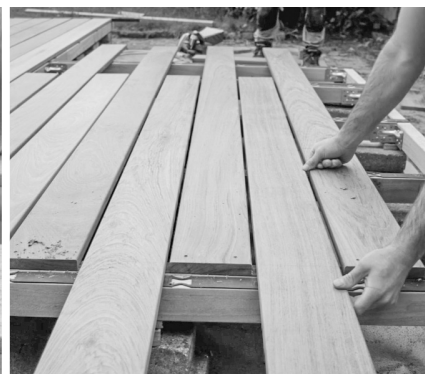
6. Placer og monter de resterende terrassebrædder.