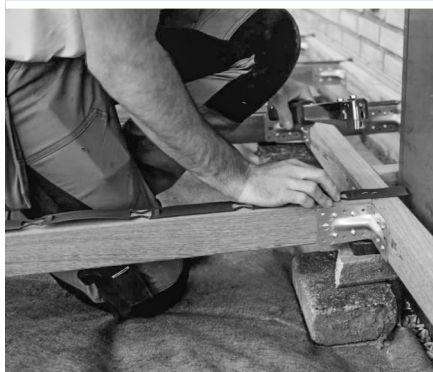
1. Fastgør Flexspacer til strøerne.