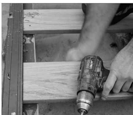
4. Placer terrassebrættet op ad afstandsmarkeringen.