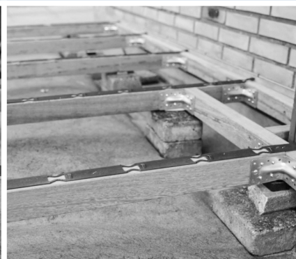
3. Fastgør Flexspacer til alle strøerne.