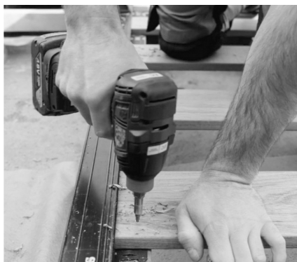
5. Fastgør terrassebrættet.