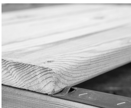
Med Flexspacer holdes en ensartet afstand.